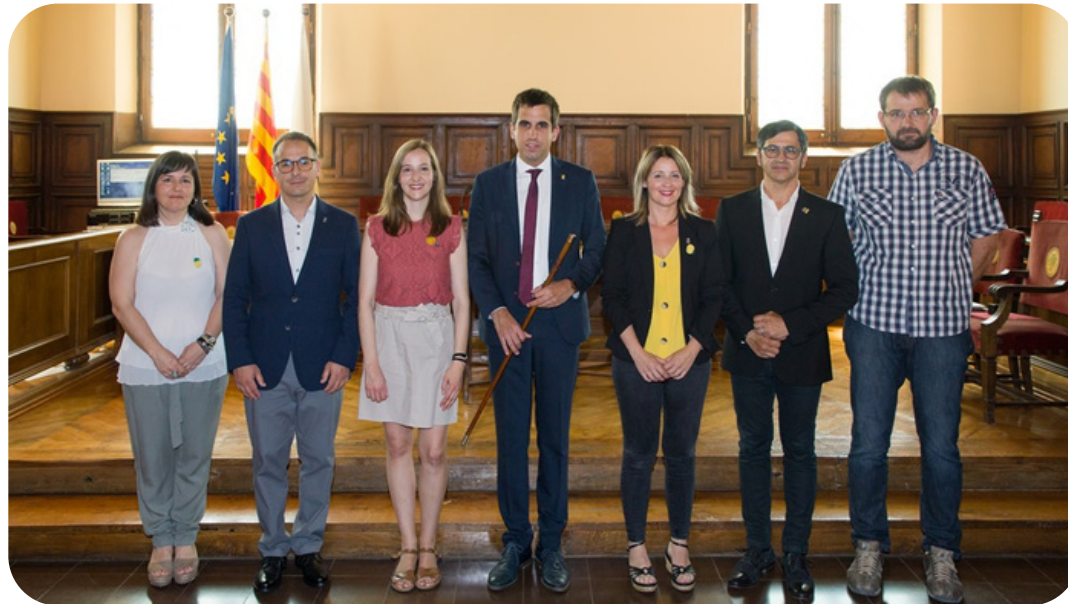
L'Equip de Govern

Cardona és un municipi amb un passat de gran rellevància històrica, que afronta el present amb optimisme i que vol treballar per un futur de noves oportunitats. Aquest Pla permetrà orientar l'acció d'aquest govern i treballar per aconseguir-ho, buscant sempre la màxima implicació i participació de la ciutadania i d'un teixit associatiu que sempre ha demostrat la seva fortalesa. Tenim molta feina per endavant, però tota l'energia per afrontar-la.